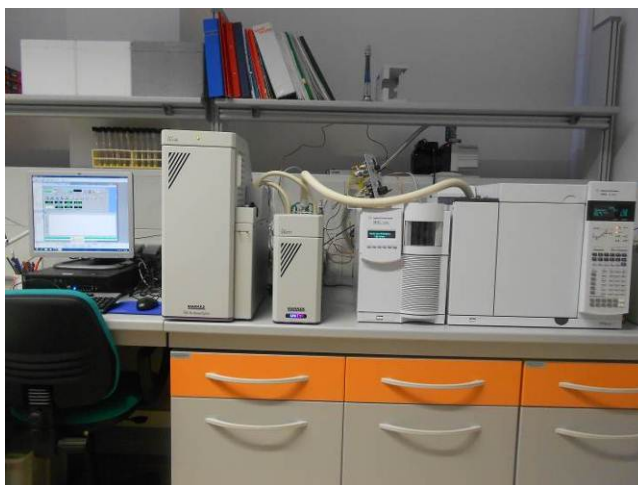
Figura 2. GC-MS 7890-5975 con Unity2 e ULTRA 50:50

Per l'identificazione ed il dosaggio delle Sostanze Organiche Volatili (SOV) è stato impiegato un sistema GC-MS mod. 7890-5975 (Agilent Technologies) dotato di autocampionatore per fiale ULTRA 50:50 (Markes International) e termodesorbitor Unity2 (Markes International) e stazione di lavoro con programma di elaborazione e database spettrale Wiley/NIST da 500.000 spettri, installato nel Laboratorio di Analisi Strumentale del Polo Tecnologico di Pavia, applicando il metodo EPA TO-15:1999.