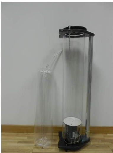
Figura 1. Campionatore passivo e contenitore in nalophan

Il Nalophan garantisce la conservazione dei campioni di aria per almeno trenta ore e non altera l'odore dei campioni stessi.