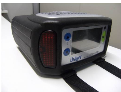
Figura 3. Draeger X-am 7000

Le concentrazioni dell'ammoniaca ( \text{NH}_3 ) e dell'acido solfidrico ( \text{H}_2\text{S} ) sono state misurate utilizzando lo strumento Draeger X-am 7000 (Dräger), la cui sensibilità è pari a 1 ppm. Le prove sono state eseguite presso il Laboratorio di Analisi Strumentale del Polo Tecnologico di Pavia, effettuando tre misurazioni per ogni campione di aria.