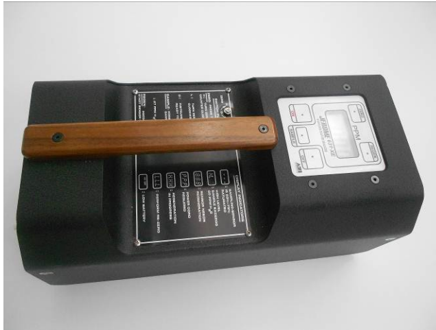
Figura 4. Analizzatore portatile di H_2S Jerome 631-XE

Se la concentrazione di acido solfidrico ( H_2S ), misurata con Draeger X-am 7000, è risultata inferiore a 1 ppm, la determinazione è stata effettuata mediante analizzatore portatile Jerome (Arizona Instruments LLC) mod. 631-XE con tecnologia a foglia d'oro (LOQ = 0.003 ppm v/v). Le determinazioni sono effettuate presso il laboratorio di Analisi Strumentale del Polo Tecnologico di Pavia, analizzando in triplo ogni campione di aria.